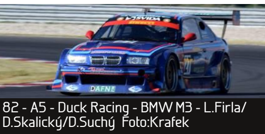
82 - A5 - Duck Racing - BMW M3 - L.Firla/D.Skalický/D.Suchý