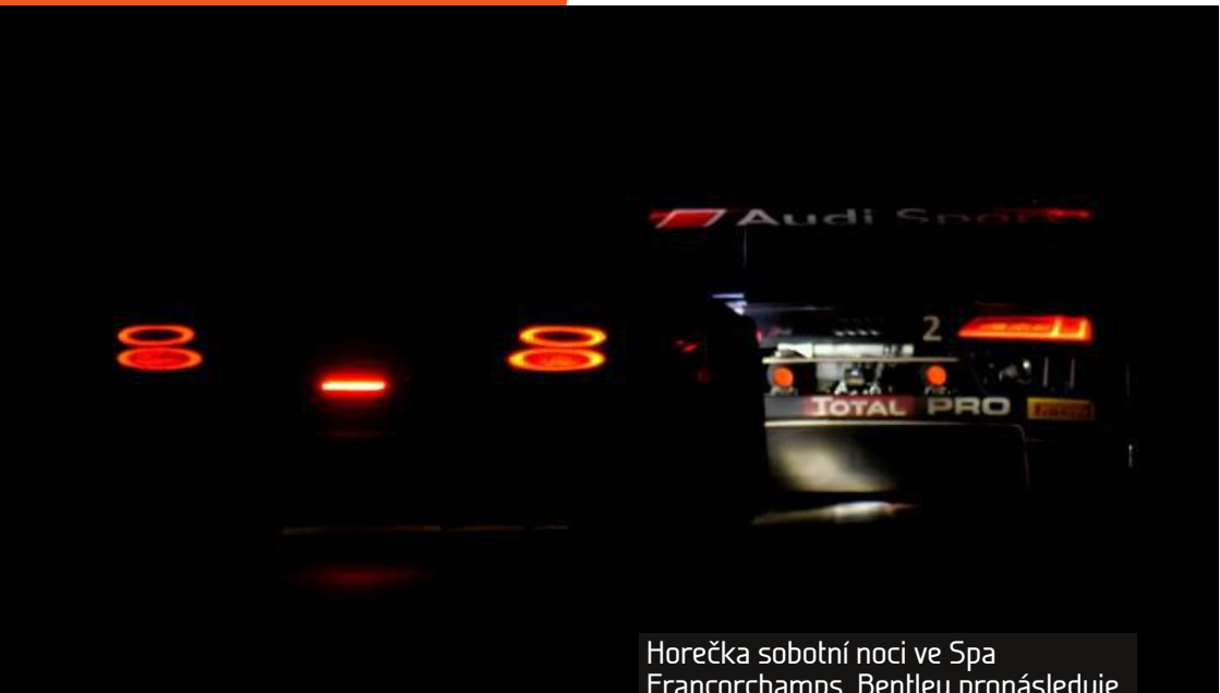
Horečka sobotní noci ve Spa Francorchamps. Bentley pronásleduje nové Audi R8.