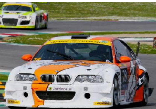
A6 - Šenkýř Motorsport - BMW Z4 - L.Maríoneck/M.Palttala/T.Erdelyi/ R.Šenkýř

Rudé Ferrari startuje v sérii vytrvalostních závodů celou sezónu a jeho posádka oplývá vedle českých gentlemanů dvěma světovými esy. Malucelli i Kox mají na kontě úspěšné starty s italskou značkou v Evropě i v USA.