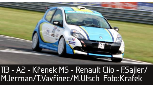
113 - A2 - Křenek MS - Renault Clio - FSajler/M.Jerman/T.Vavřinec/M.Utsch