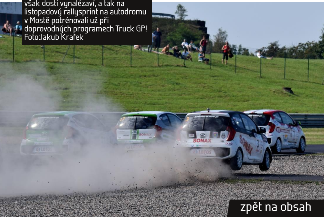
Trénování na rally mimo seznamovací jízdy je zakázané. Někteří piloti jsou však dosti vynalézaví, a tak na listopadový rallysprint na autodromu v Mostě potrénovali už při doprovodných programech Truck GP!