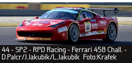
44 - SP2 - RPD Racing - Ferrari 458 Chall. - D.Palcr/J.Jakubík/L.Jakubík